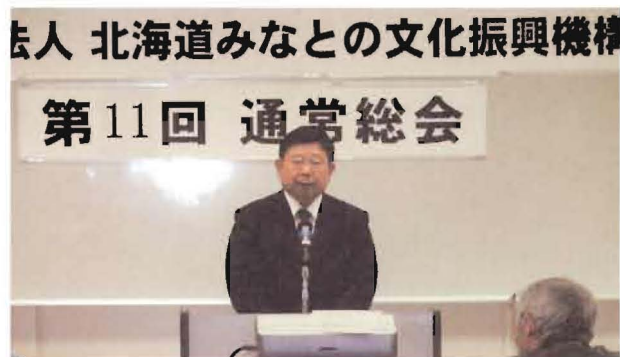
川合港湾空港部部長挨拶